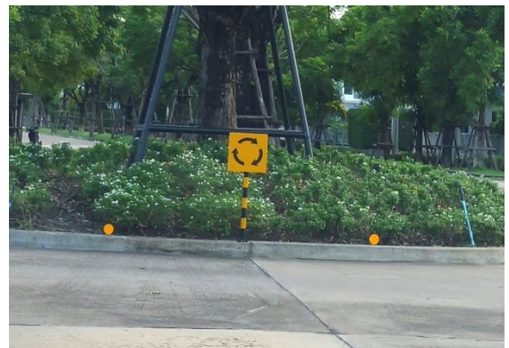
รูปที่ ก-8 ป้ายสัญญาณจราจรประเภทต่างๆ ภายในโครงการ