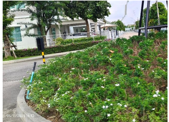
รูปที่ ก-7 ใช้น้ำทิ้งสุดท้ายรดน้ำต้นไม้แบบซึมดิน