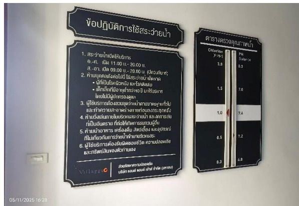
รูปที่ ก-20 ตรวจสอบน้ำในสระจ่ายน้ำเป็นประจำ