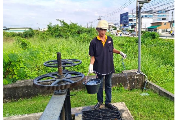
รูปที่ ก-21 ตรวจสอบน้ำในระบบบำบัดน้ำเสียรวม