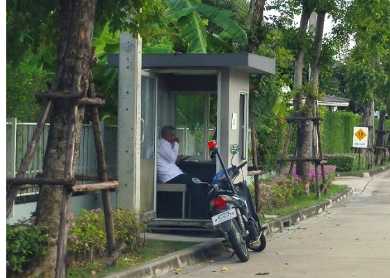
รูปที่ ก-13 การรักษาความปลอดภัยในพื้นที่โครงการตลอด 24 ชั่วโมง