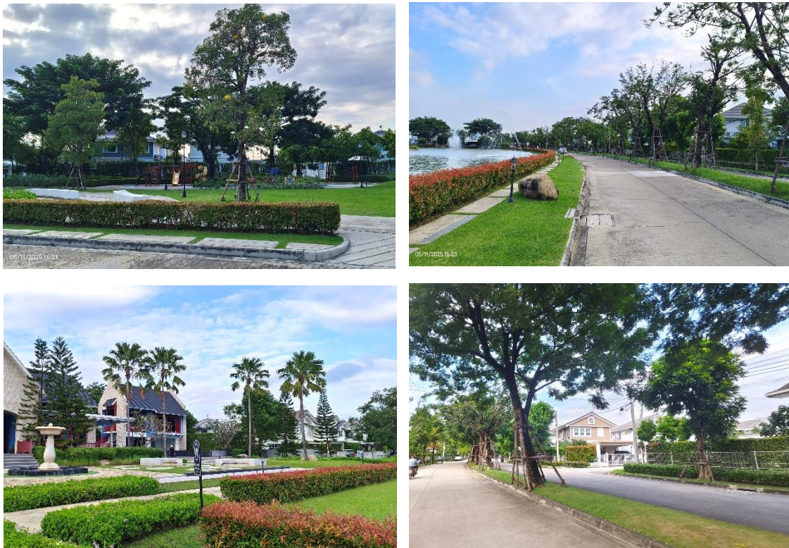
รูปที่ ก-5 พื้นที่สวนหย่อม เกาะกลางถนนโครงการ และการปลูกหญ้าคลุมดิน