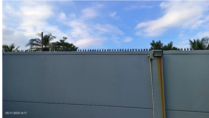
รูปที่ ก-3 รั้วรอบพื้นที่โครงการที่มีส่วนกันขโมย ความสูง 2.8 เมตร