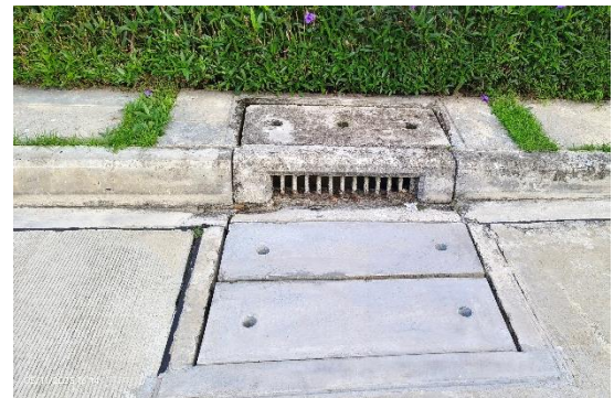
รูปที่ ก-18 ตะแกรงดักขยะ