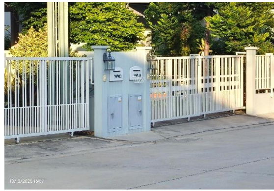
รูปที่ ก-10 ถึงขยะสำหรับแปลงที่ดินบ้านเดี่ยว