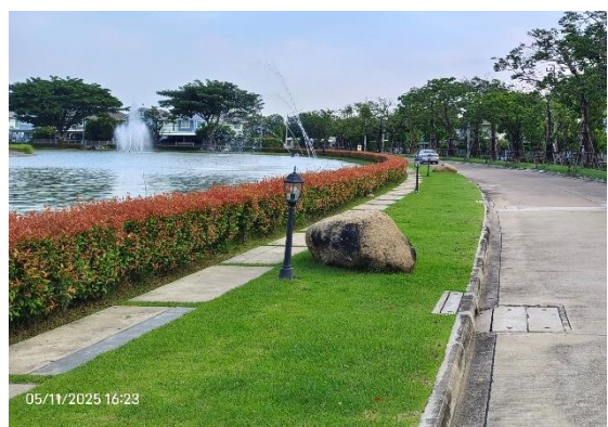
รูปที่ ก-15 ไฟส่องสว่างตามแนวถนนและพื้นที่ส่วนกลาง