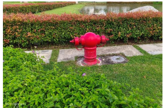
รูปที่ ก-16 หัวดับเพลิง (Fire Hydrant) ที่ได้ติดตั้งในพื้นที่ 1