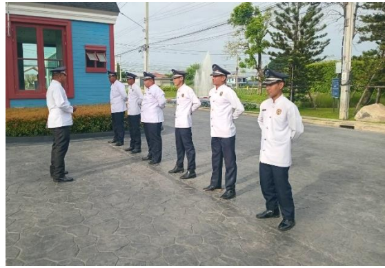
รูปที่ ก-11 การฝึกอบรมพนักงานรักษาความปลอดภัยในเรื่องป้องกันและบรรเทาอัคคีภัยเบื้องต้น