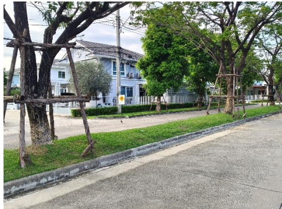
รูปที่ ก-14 การดูแลรักษาความสะอาดสิ่งแวดล้อมภายในโครงการเป็นประจำและสม่ำเสมอ