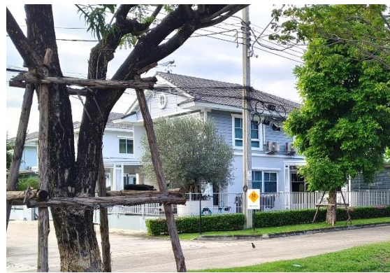
รูปที่ ก-12 การออกแบบก่อสร้างที่เป็นไปตามมาตรฐานและเลือกใช้วัสดุที่เหมาะสม