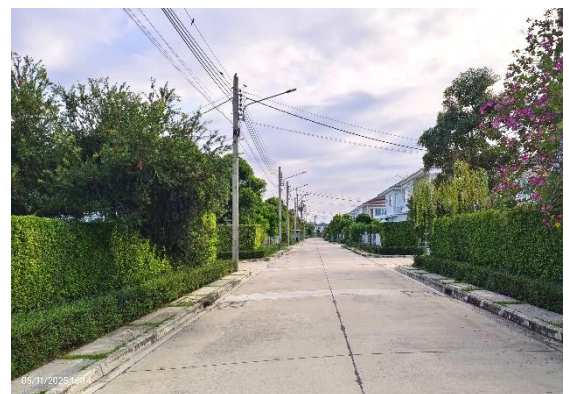
รูปที่ ก-9 ลักษณะถนนภายในโครงการ