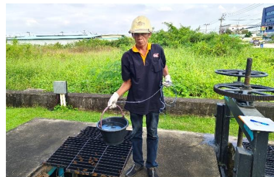
รูปที่ ก-4 ระบบบำบัดน้ำเสียขั้นต้นประจำบ้าน และระบบบำบัดน้ำเสียรวมส่วนกลาง พื้นที่ที่ 1