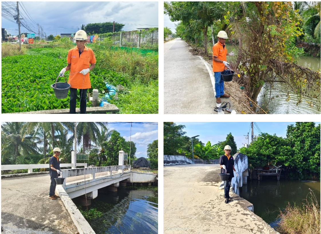
รูปที่ ก-19 เก็บน้ำบริเวณคลองสาธารณะ