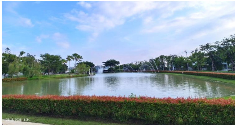
รูปที่ ก-17 บ่อหนองน้ำ