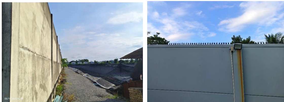
รูปที่ ก-6 การป้องกันการชะล้างพังทลายของดิน โดยจัดทำเป็นกำแพงล้อมโครงการ